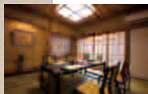
和室椅子席(20名様まで)