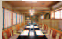
2階宴会場(26名様まで)